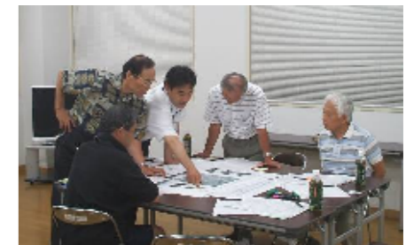
まちづくり勉強会の様子

まちづくり勉強会では、来年度から、まちづくりの概略計画を検討していきます。少しずつ具体的な計画となっていくため、一緒に検討をしていただけるメンバーを募集します。