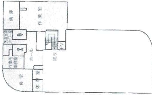
総合福祉センター しいの木2階

花見・調理実習・誕生会・クリスマス会 買物実習・日帰り研修・宿泊行事・産業祭 福祉フェスティバル など参加しています。