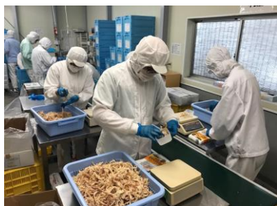
袋詰め作業(ライン)

★作業内容が数多く有り、ひとりひとりにあった対応をしています。 ★作業の中であいさつ・連絡・報告・相談など訓練をする場として将来的に一般企業への就労を目標とした基本的な姿勢を身に付ける事への支援をしています。