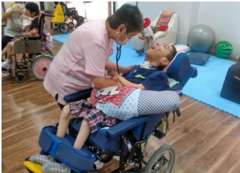
＜体調管理＞ 毎日、看護師によるバイタルサインの確認を行っています。