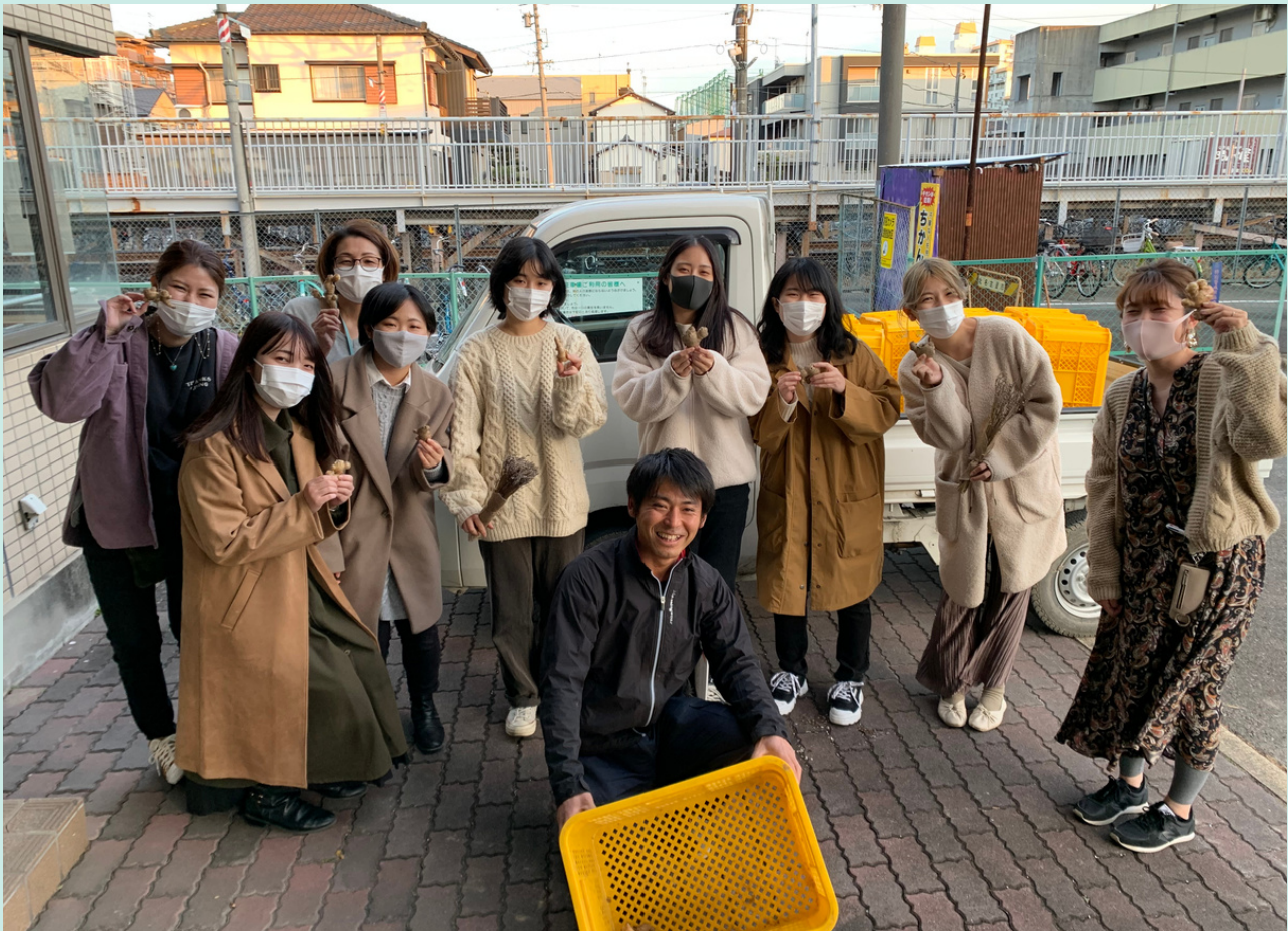
mama life expo 2020