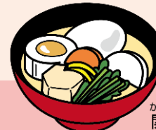
かんざいふうぞうに 関西風雑煮