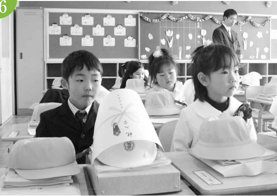
入学式 鴨田小学校