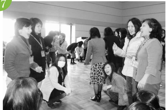
市子ども会連絡協議会指導者研修会 文化勤労会館