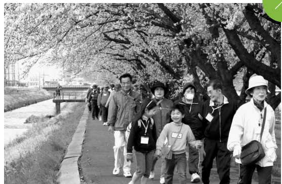
さくらスマイルウォーキング 師勝東小学校から小牧山までの往復