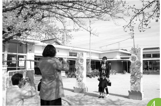
入園式 薬師寺保育園