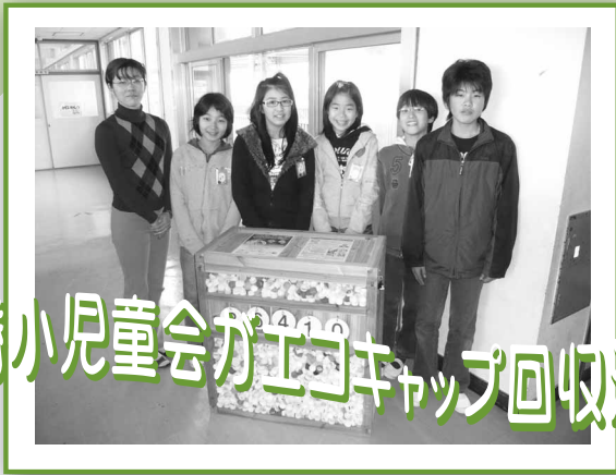
師勝小児童会がエコキャップ回収活動

子どもたちにとって、身近なペットボトルキャップを集めることが、環境、資源、医療、貧富格差など、世界的な問題を考えるきっかけになればいいですね。