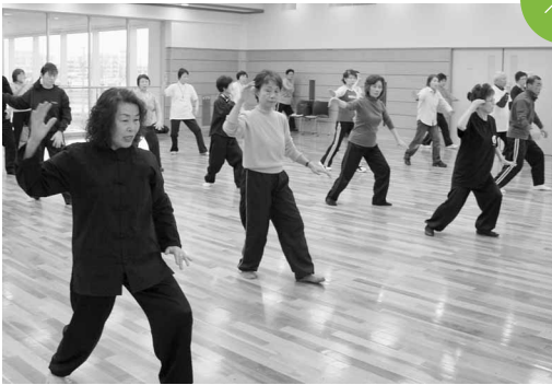
ふれあいスポーツフェスタ 健康ドーム