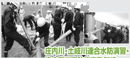
庄内川・土岐川連合水防演習・ 複合型災害防災実動訓練

伊勢湾台風50年を機に、水防演習とあわせて、洪水・高潮が同時発生する複合型災害を想定した防災実動訓練を実施します。