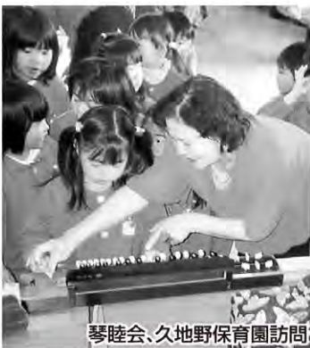
琴睦会、久地野保育園訪問