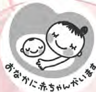
マタニティマーク

妊娠中、特に初期は、赤ちゃんの成長はもちろんお母さんの健康を維持するためのもとても大切な時期です。しかし、外見からは、妊婦であるかどうか判断しにくい場合があります。