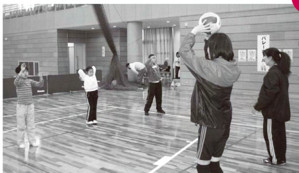
ふれあいスポーツクラブ主催『ふれあいスポーツフェスタ』 健康ドーム