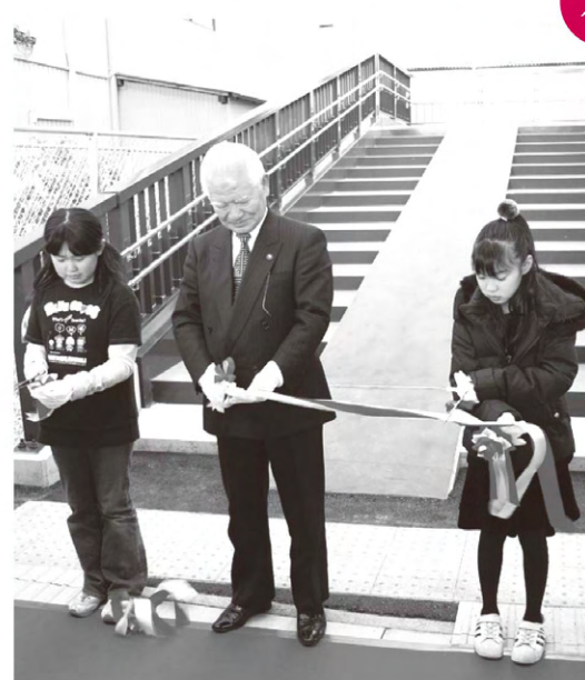
くりっこ歩道橋「渡り初め式典」 中之郷交差点南東