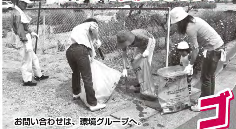
お問い合わせは、環境グループへ。