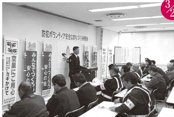
防犯ボランティア「安全なまちづくり研修会」 総合体育館