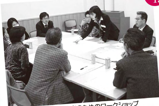
北名古屋市総合計画策定のためのワークショップ 健康ドーム