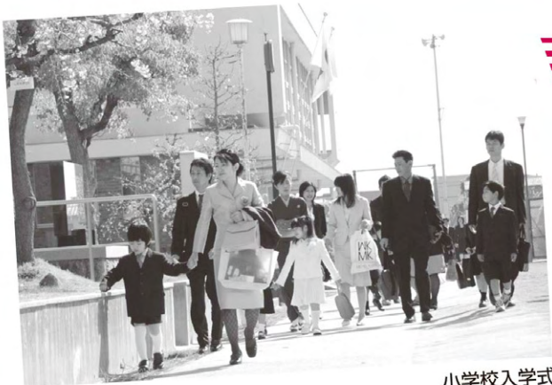
小学校入学式 五条小学校