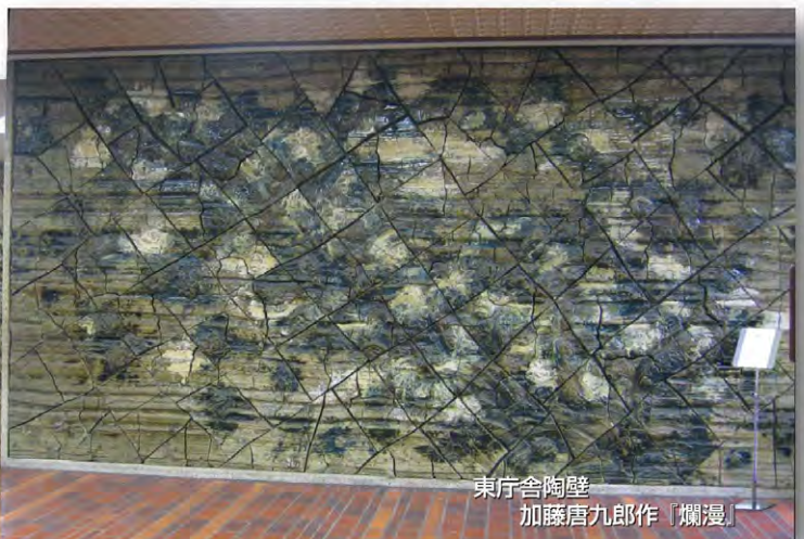
東庁舎陶壁 加藤唐九郎作「爛漫」