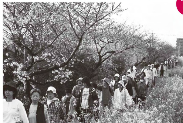
おはよう あるけあるけ大会 師勝東小学校から小牧山まで

東給食センターでは、小学5年生から中学生を対象とした『子ども料理教室』を東保健センターで行いました。自分で調理することで、食べ物に対する関心を高め、健康管理ができるようになってもらおうと、毎年開催しています。今回は23人が参加。センターの学校栄養職員の指導でおにぎりや鶏のつくね煮など栄養バランスのとれた料理をつくり弁当箱に詰めました。子どもたちは学校栄養職員の説明を聞き、「嫌いなものでも自分でつくるとおいしくなるかな」とさっそく関心を持ったようでした。