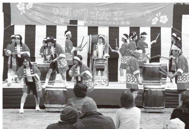
合瀬川桜まつり コッツ山公園