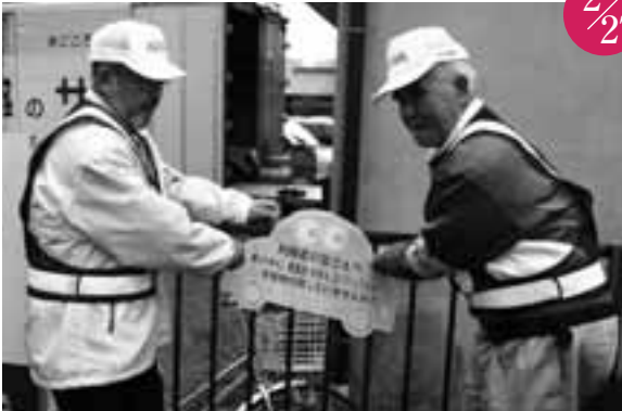
自動車関連犯罪の抑止キャンペーン 西春駅東ロータリー歩道周辺