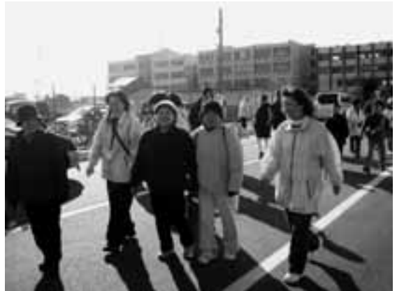
五条スポーツクラブ主催「歩け歩け大会」 五条小学校から岩倉市まで