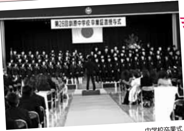
中学校卒業式 訓原中学校