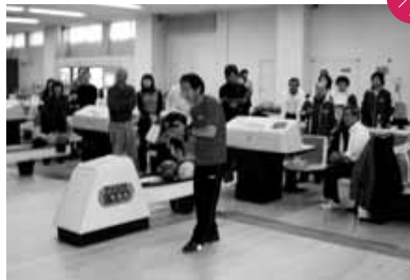
白木・栗島スポーツクラブ主催『ふれあいボウリング大会』