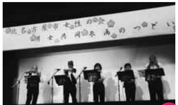
女性の会主催「男女共同参画のつどい」 総合体育館

3月で卒業する6年生93人を祝う会が五条小学校で行われました。6年生を中心に、先生やPTA「おやじの会」が力を合わせて「もちつき」を行い、全校でつくたてのおもちを食べて卒業を祝いました。最後は、参加していただいた地域の皆さんに感謝の気持ちを伝え、金管バンド部の演奏を贈りました。残りわずかな小学校生活。6年生にとって今日のこの会は、心に残る思い出となりました。