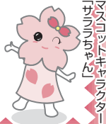
マスコットキャラクター「ザラちゃん」