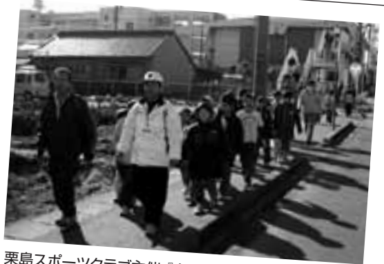
栗島スポーツクラブ主催「ウォーキング大会」 栗島小学校区内