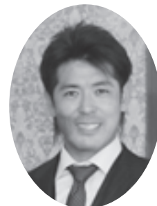
稲葉 篤紀 さん