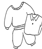
着替え用の服（上下）