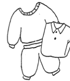
着替え用の服（上下）