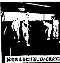
隊員の山形に付添している奥がエシ