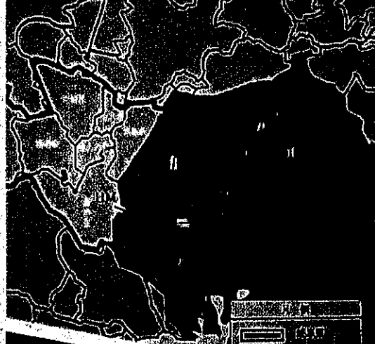
西日本豪雨に伴う災害派遣（30.7.22~29）④