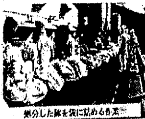
分けした袋を袋に詰めると様子