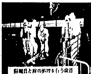
消毒員と豚の処理を行う様子