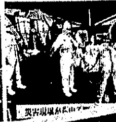
奥が山形が山形で