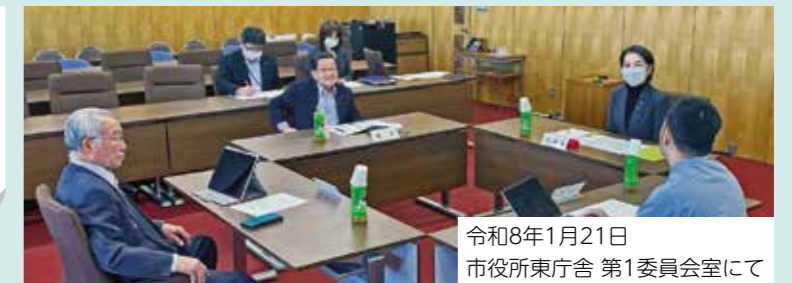
令和8年1月21日 市役所東庁舎 第1委員会室にて

会議を傍聴していただき、議会・議員活動に対するご意見やご提案をいただいています。毎年2月に募集し、1年間(4月～翌年3月)の任期で活躍していただきます。