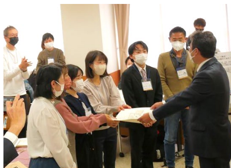
市長へリノベーションイメージ案を手渡す参加者代表