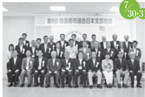
健康都市連合日本支部大会 健康ドーム・文化勤労会館