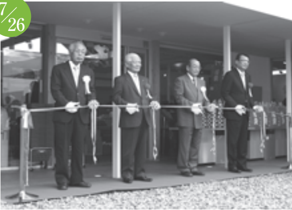
「食のアウトレットモール北名古屋」オープニングセレモニー 食のアウトレットモール北名古屋(法成寺地内)