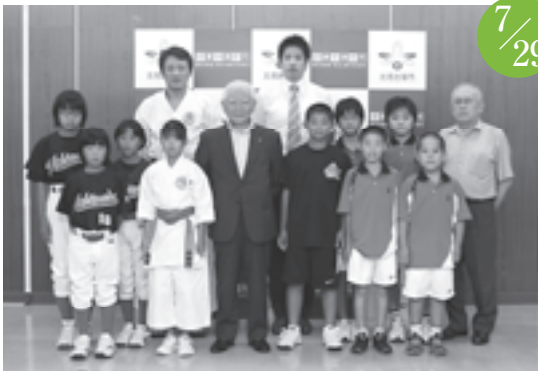
スポーツ競技全国大会出場者激励会 市役所西庁舎