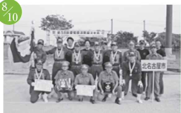
第 58 回愛知県消防操法大会で、北名古屋消防団はポンプ車操法の部に出場し、見事「準優勝」に輝きました。 西尾市一色町