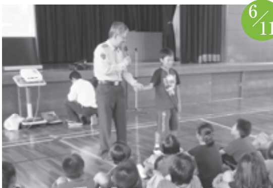
防犯教室 白木小学校