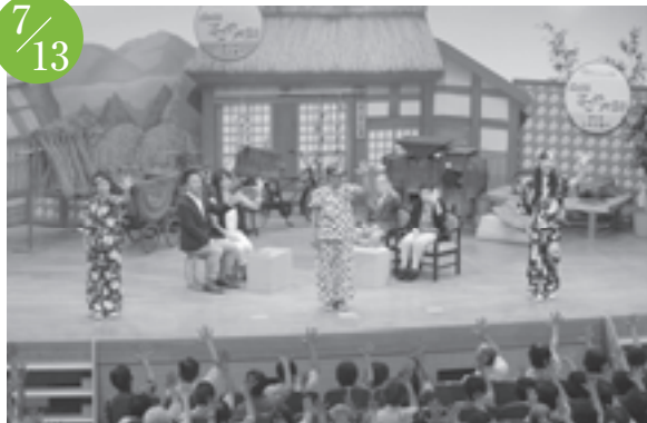
ハートネットTV公開すこやか長寿公開録画 文化勤労会館