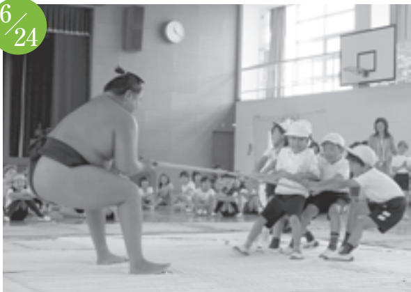
式秀部屋 鴨田小学校訪問 鴨田小学校