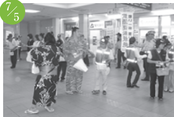
市青少年育成会議・市少年補導委員会 非行防止啓発活動 名鉄西春駅改札口周辺