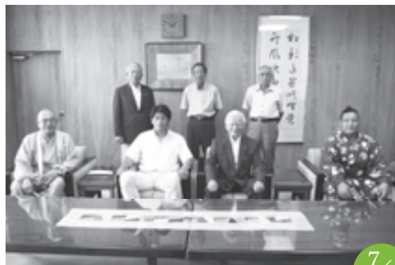
立浪部屋 市役所表敬訪問 市役所西庁舎