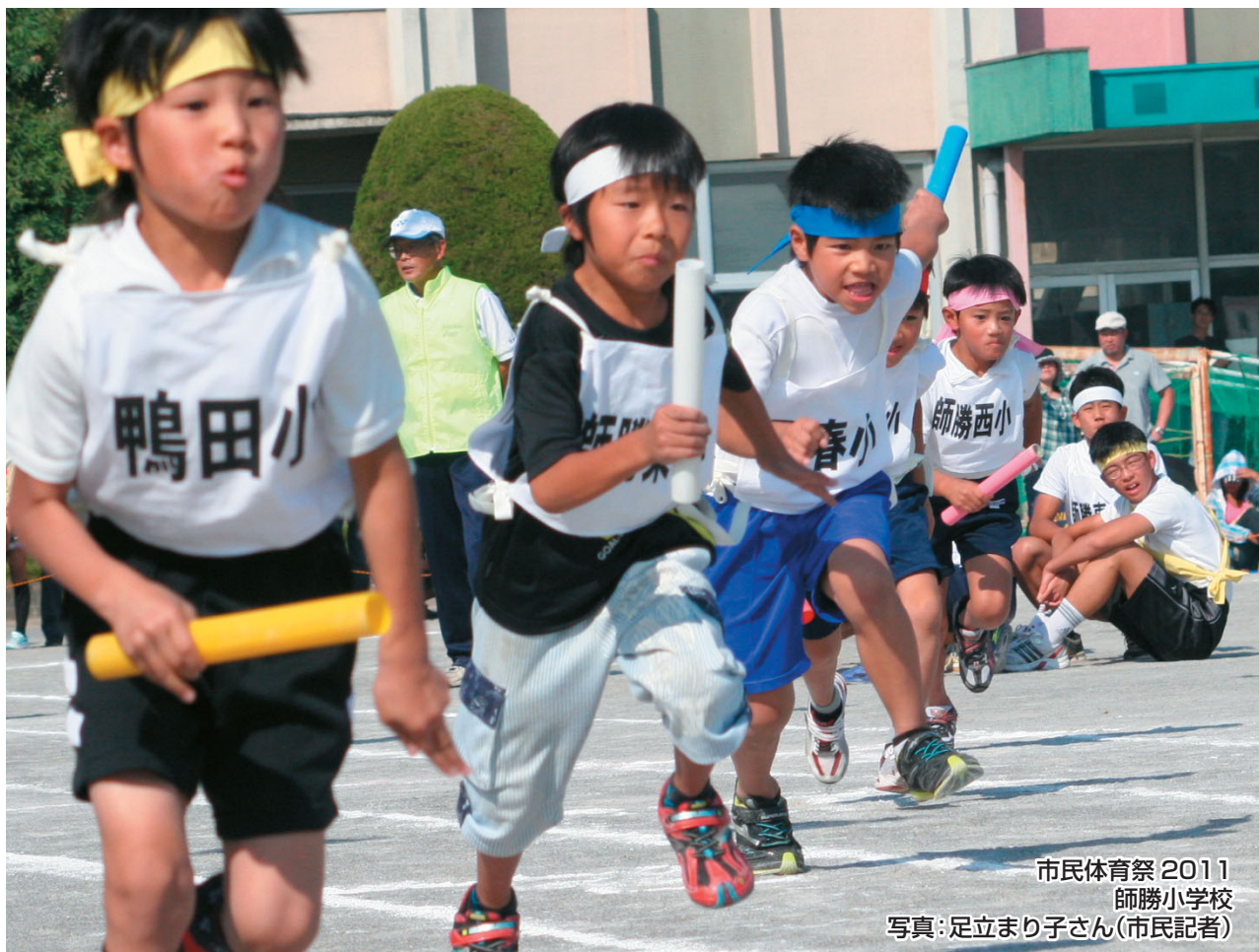
市民体育祭 2011 師勝小学校