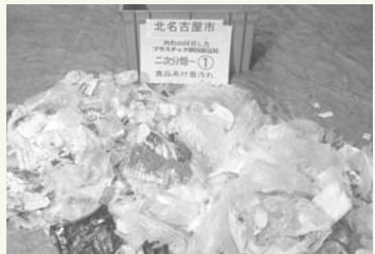
▲品質検査の結果、食品汚れのためリサイクルできないもの