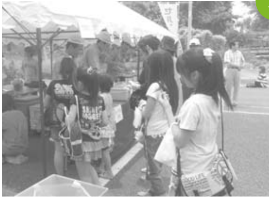
セルフしかつ祭 セルフしかつ