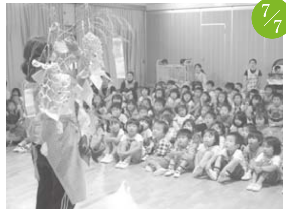
七夕まつり 弥勒寺保育園