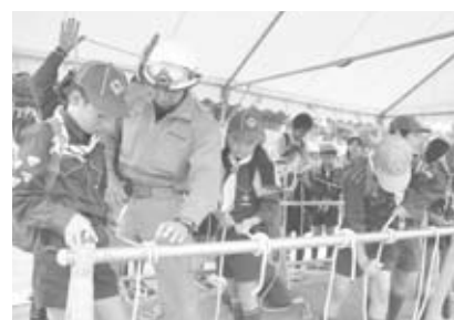
▲消防隊員によるロープの結び方教室