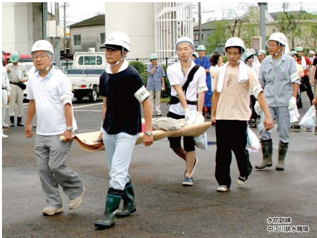
水防訓練 中江川排水機場