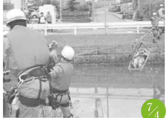
水防訓練(表紙も同じ) 中江川排水機場

健康ドームで「食育プチまつり」が開催されました。これは食育の大切さを市民のみなさんにも知ってもらおうと、市や協力団体が中心となって開催したものです。会場には「食」に関するパネルや自分でおにぎりを作るコーナー等が設けられ、訪れた市民の方は楽しみながら食育について学んでいました。また、地元産の野菜や野菜入りパンの販売も行われ、「楽しさ」と同時に「おいしさ」も味わうことができるお祭りになりました。