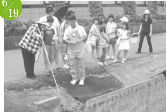
児童館環境学習 宇福寺児童館