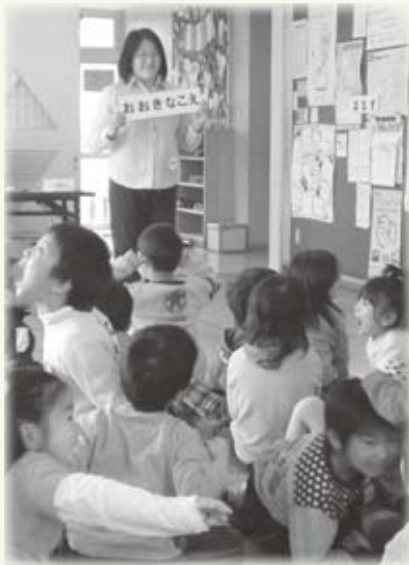
▲大声を出す練習をする子どもたち

鍛冶ケ一色児童館で「1年生をお祝いしよう」の会が開かれました。その中で「母の会」による、防犯知識をつけるための紙芝居と指導が行われました。