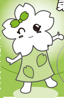
イラスト：サトウハチロー

子どもの個性と豊かな創造性を伸ばすことを目指し、「北なごやおはなし大賞」の作品を募集します。これは、皆さんが考えたオリジナルの楽しいおはなしを募集するもので、大賞に選ばれた作品は人形劇となって、来年のパペットフェスタ2011で上演する予定です。家族やお友だちと一緒に応募できます。ぜひ応募ください。