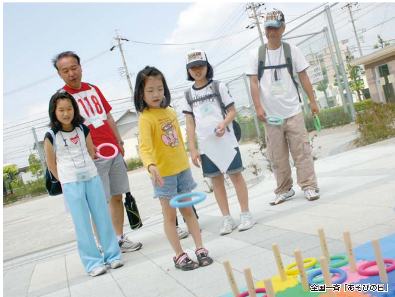
全国一斉「あそびの日」