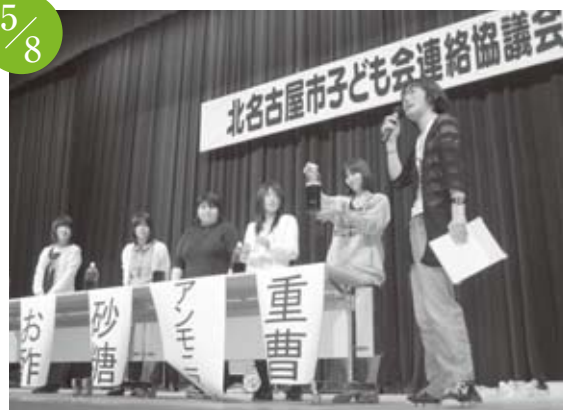
子ども会連絡協議会総会 文化勤労会館