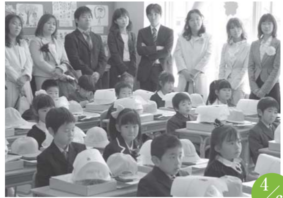
入学式 師勝東小学校