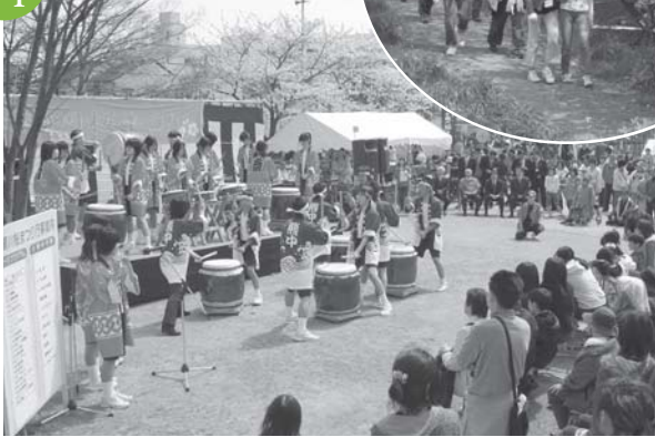
さくらまつり・さくらスマイルウォーキング コツ山公園・師勝東小学校から小牧山までの往復