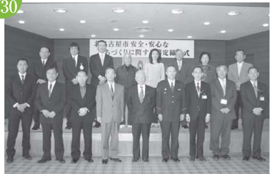
北名古屋市安全・安心なまちづくりに関する協定締結式 市役所東庁舎