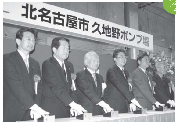
久地野ポンプ場竣工式 久地野ポンプ場