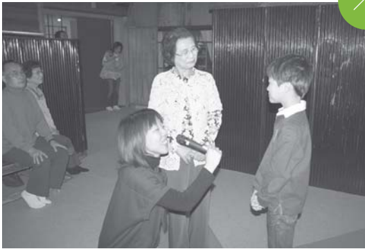
あなたの道 × わたしの道 思い出の交換 歴史民俗資料館