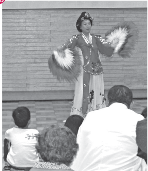
市国際交流協会主催「韓国フェア」 文化勤労会館