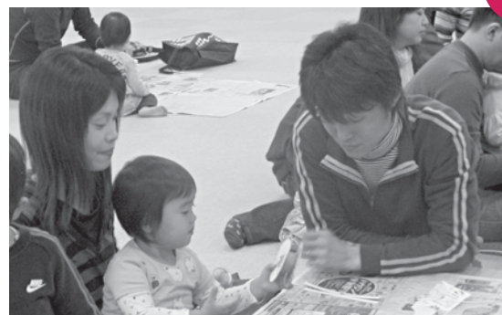
パパのための育児講座 健康ドーム