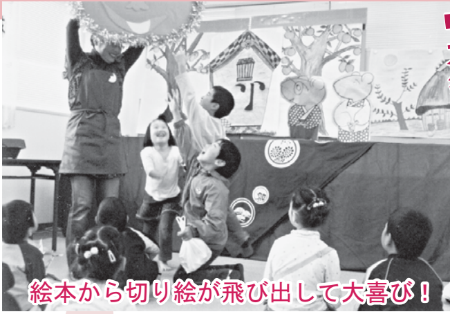
絵本から切り絵が飛び出して大喜び!