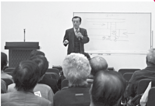
老人クラブ連合会東地区交通安全教室 総合福祉センターもえの丘