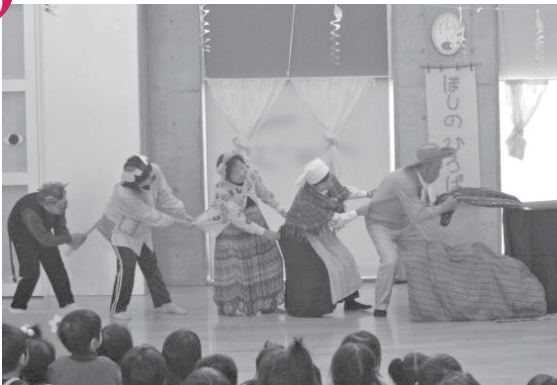
お楽しみ会 南子育て支援センター