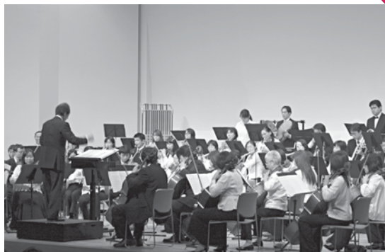
市民音楽祭 文化勤労会館