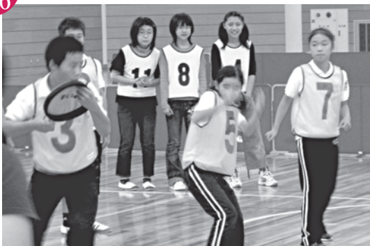
市子ども会「ドッチビー大会」 健康ドーム