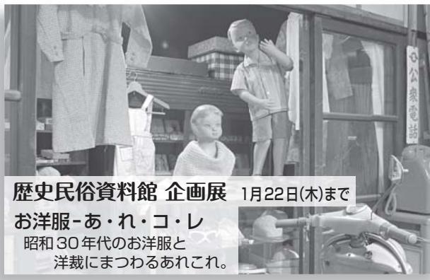
歴史民俗資料館 企画展 1月22日(木)まで お洋服-あ・れ・コ・レ 昭和30年代のお洋服と 洋裁にまつわるあれこれ。