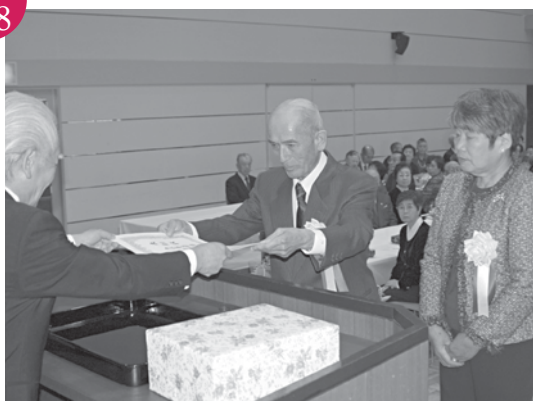
金婚祝賀式 文化勤労会館