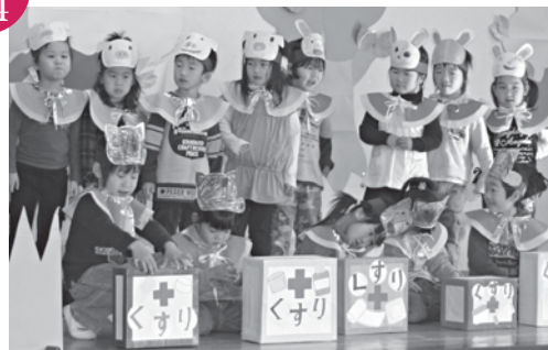
生活発表会 薬師寺保育園