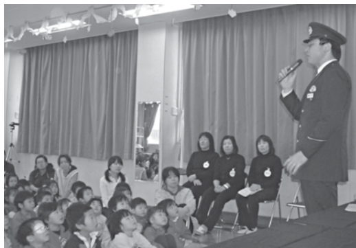
防犯教室 六ツ師保育園