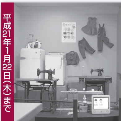
平成21年1月22日(木)まで