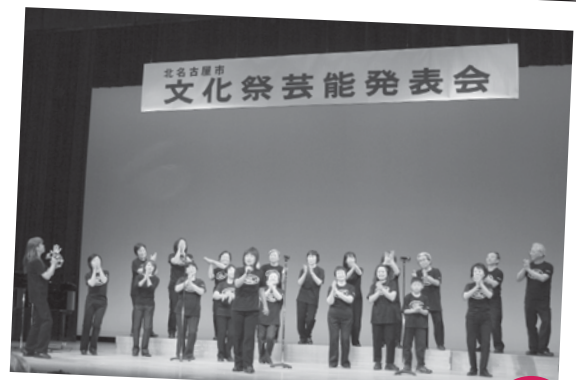
文化祭 文化勤労会館