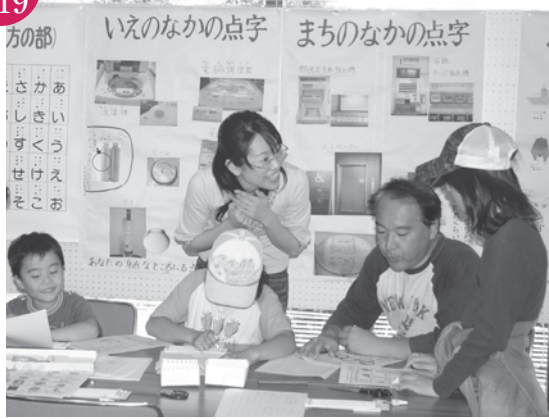
ボランティアまつり 文化勤労会館