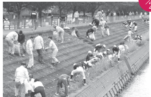
合瀬川等清掃活動 合瀬川周辺