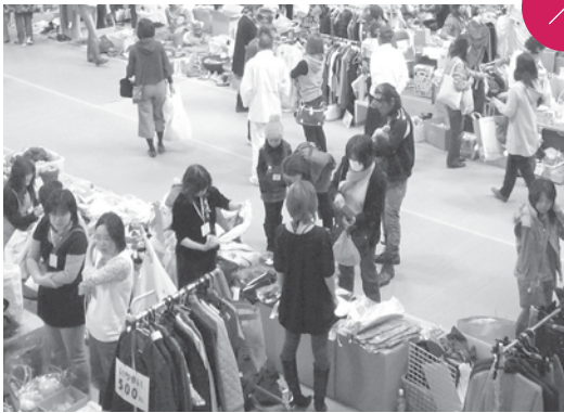
BanBanマーケット 総合体育館