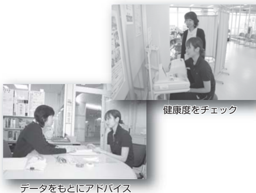
健康度をチェック