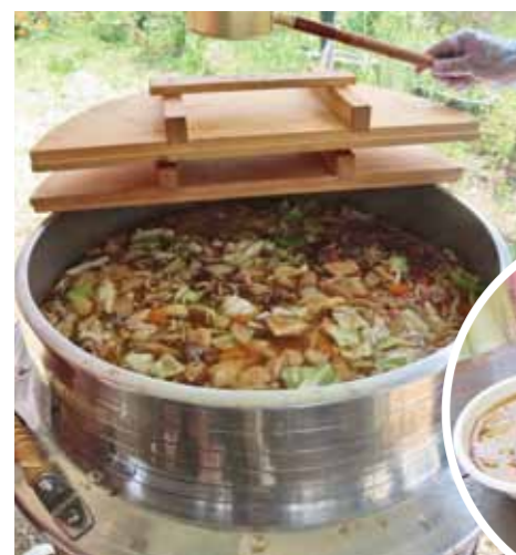
▲振る舞われたちゃんこ鍋

ちゃんこ鍋について親方に聞いたところ、ちゃんこは親方と弟子の関係から親方を「父(ちゃん)」、弟子を「子(こ)」と置き換え、師弟ともに食べるものを「ちゃんこ」と呼ぶようになった説もあるとのこと。力士の食事は一日2回、朝稽古が終わった後の昼と、夕方であることを知りました。また、お相撲さんが作る料理はすべて「ちゃんこ」と呼ぶとのことでした。この日振る舞われたちゃんこ600杯、おにぎり400個は、1時間ほどでなくなってしまうほどの大人気でした。