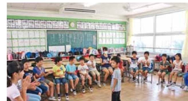
▲エアコン環境下で行われる学習活動の様子(写真は西春小学校の縦割り班おたのしみ集会)。

市では、児童・生徒が集中して学習に取り組むことができる良好な環境を整えるため、「全小中学校の普通教室および特別教室に空調機を整備する事業」を市の重点的な取り組み(主要事業)の一つとして掲げ、早期整備に向けて計画を進めてきました。現在、中学校のエアコン整備も来年2月の完成を目途に進めています。