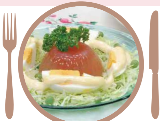
『誰にも簡単に出来る 家庭西洋料理全集』 婦人倶楽部 昭和 8 年 9 月号附録

トマトを擂（す）り潰して寒天で固めたもの。ピールのお肴（さかな）にも結構ですが、お子様のお八つには殊（こと）によいものです。見たところ涼しさうなものです。